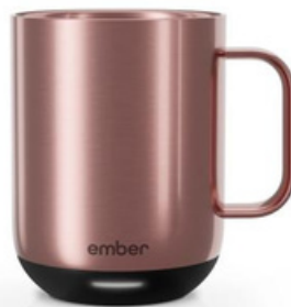
Ember Mug 2 10 oz / 295ml