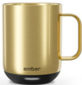
Ember Mug 2 10 oz / 295ml