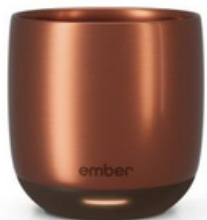
Ember Cup 6 oz / 178ml