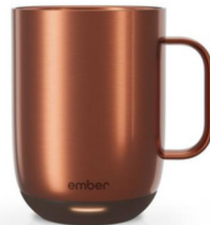
Ember Mug 2 14 oz / 414ml