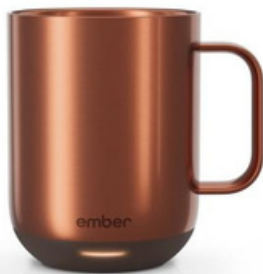
Ember Mug 2 10 oz / 295ml