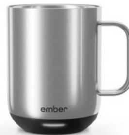
Ember Mug 2 10 oz / 295ml